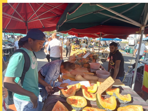
Relevé des prix et interview d'un forain

Une synthèse et un compte rendu de sortie ont été effectués en classe.