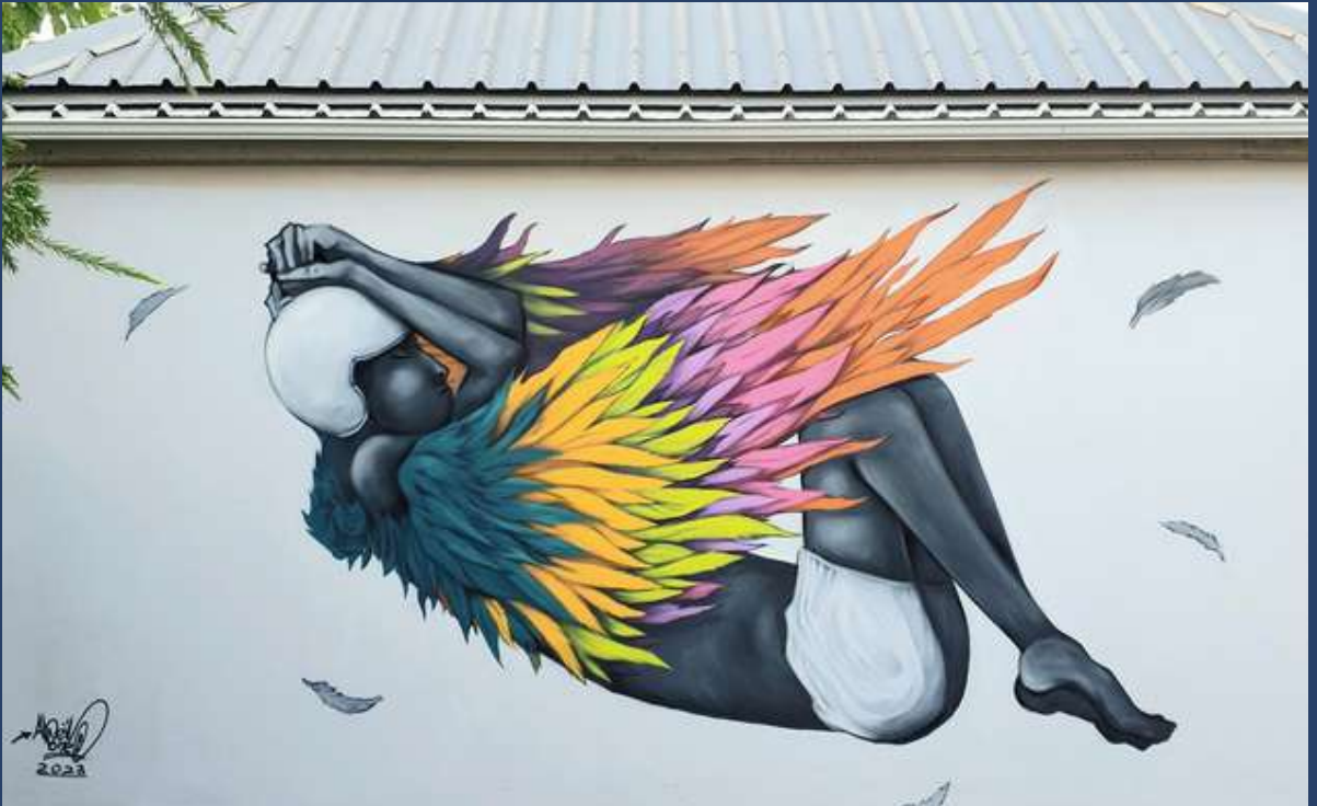
La chute d'Icare, Performance de l'artiste ABEILone.