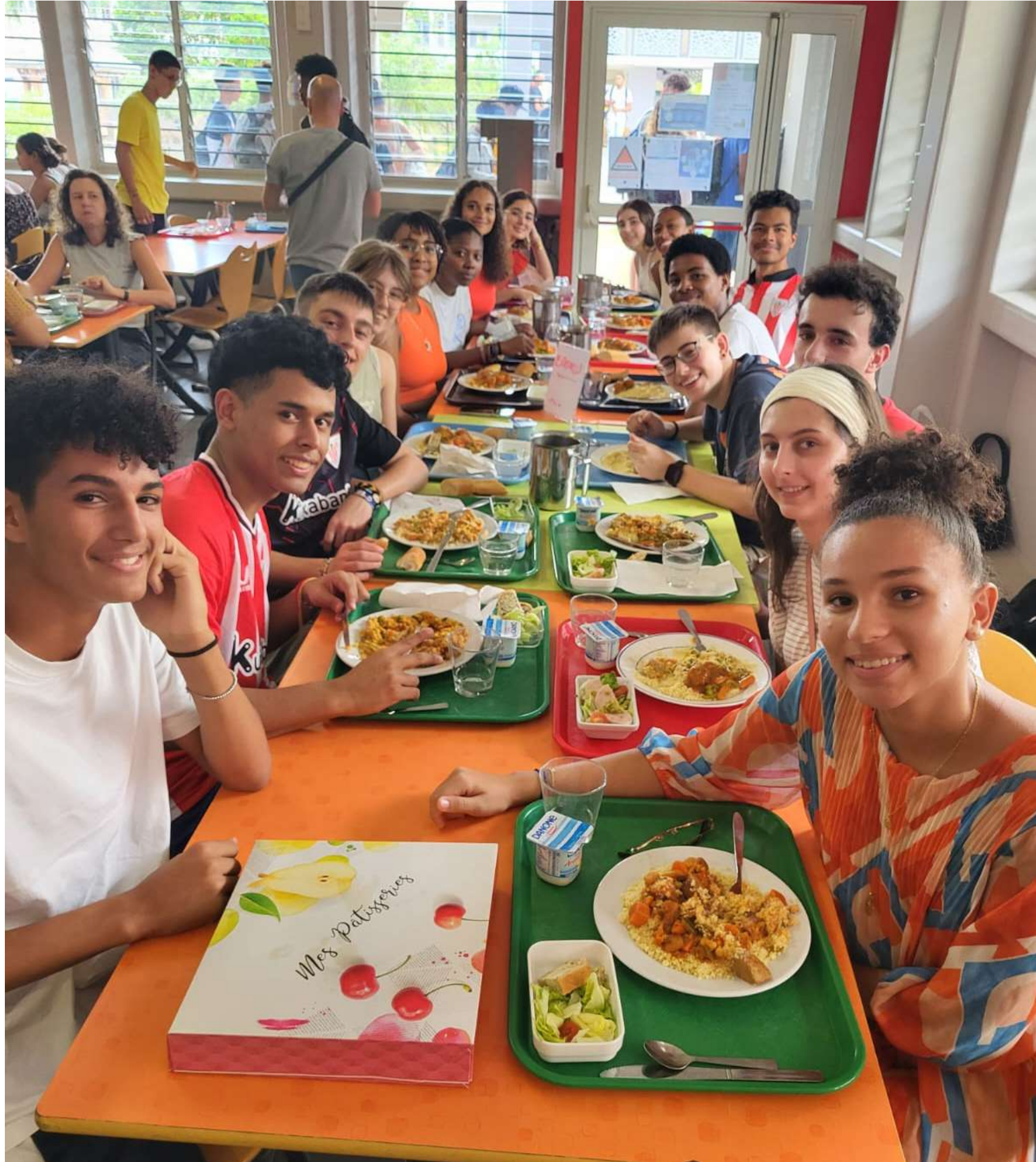
✓ 28/03 déjeuner à la cantine