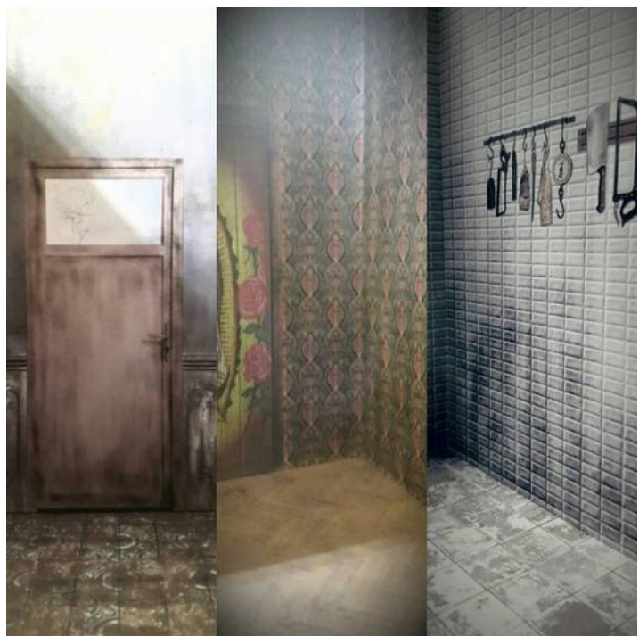
Vues intérieures de la maquette (détails)