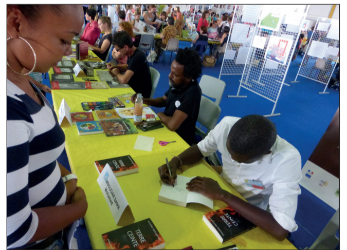
On a eu une dédicace de Mohamed Mbougar Saar.

Les lycéens du bac pro commerce de Moulin-Joli (La Possession) ont quant à eux aidé à la