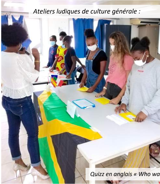
Quiz en anglais « Who wants to be a millionaire ? »