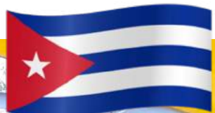
La salsa, danse cubaine