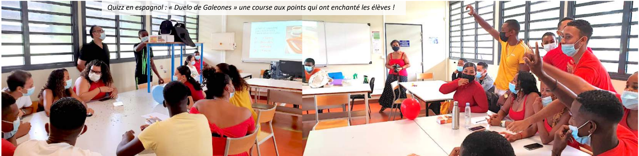
Quiz en espagnol : « Duelo de Galeones » une course aux points qui ont enchanté les élèves !