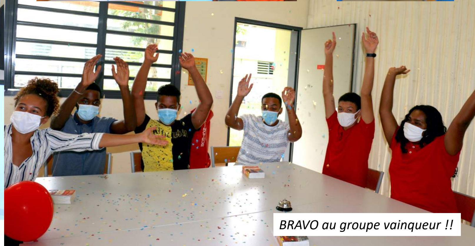
BRAVO au groupe vainqueur !!