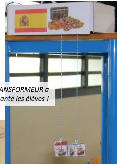
LE TRANSFORMEUR a encore enchanté les élèves !