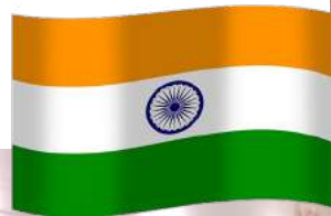
Le Bharata natyam, danse indienne