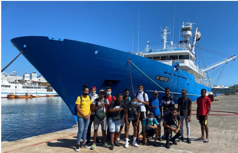
Promotion de 2021-2023

Lors des 50 ans du lycée Lépervanche, les élèves de la 1 re année et de la 2 e année défilent ensemble.