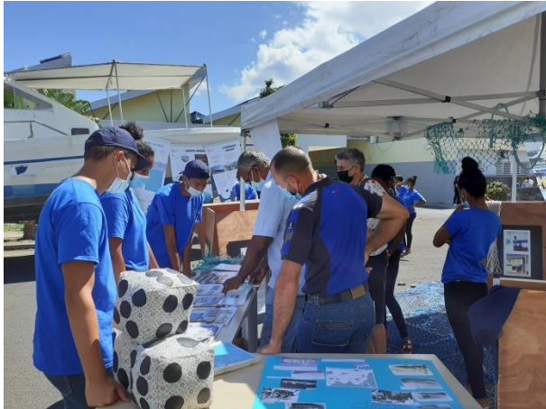
Quatre carnets de voyage présentés par un groupe d'élèves (1 re et 2 e années)