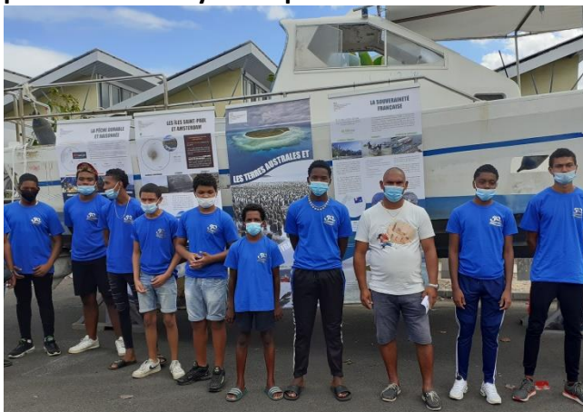
Ancien élève BAC PRO ELEEC – Professionnel à la DMSOI qui pose avec les élèves.

La première matinée permettait de rencontrer d'anciens élèves, agents et professeurs du lycée Lépervanche.