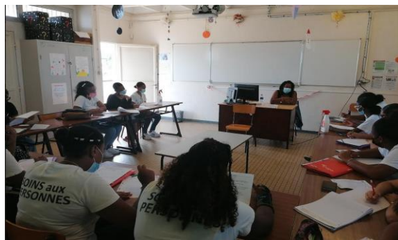
Professionnelle en Établissement Scolaire Post bac pro ASSP - AESH primaire collège Aide-soignante CHOR - Pompier volontaire