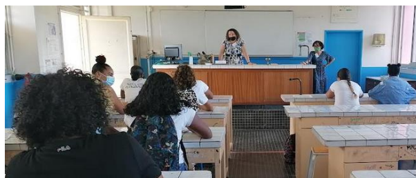
Professionnelle à domicile Accompagnante éducative et sociale Service d'aide à domicile