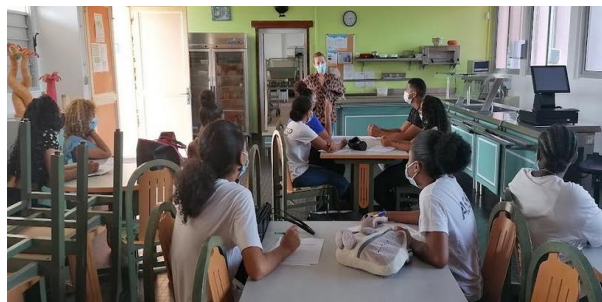
Professionnelle en Structure Post BEP CSS-Bac ST2S - Aide-soignante CHOR

Avec l'aimable participation des professionnelles : • De la Petite Enfance • D'Établissement Scolaire • Du Service d'aide à Domicile • En Structure – Hôpital Clinique