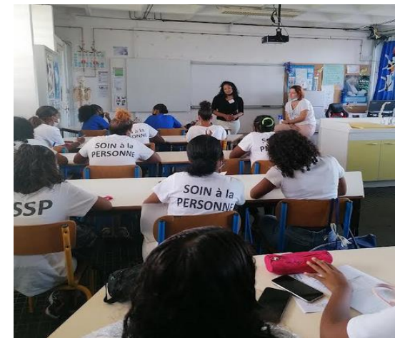
Professionnelles de la Petite Enfance Post Bac pro ASSP - CPSIP Auxiliaire de puériculture Crèche – Maternité - Néonatalogie