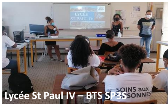
Lycée St Paul IV – BTS SP3S