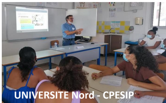
UNIVERSITE Nord - CPESIP