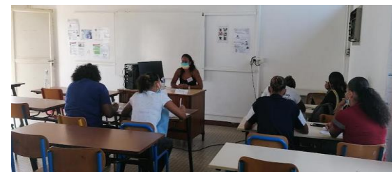
Professionnelle de la Petite Enfance Post BEP CSS – Prépa IFCASS DIEPPE DE Auxiliaire de puériculture en alternance AP Crèche