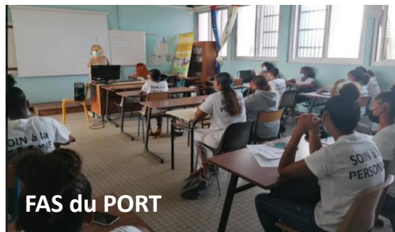
FAS du PORT