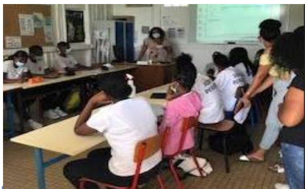
Infirmière au Canada - FF Auxiliaire en crèche Présentation de la formation en mobilité CEGEP – CNARM - LADOM

Avec l'aimable participation des professionnelles : • De la Petite Enfance • D'Établissement Scolaire • Du Service d'aide à Domicile • En Structure – Hôpital Clinique