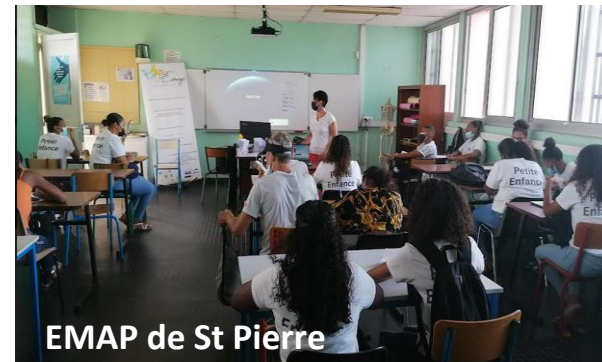
EMAP de St Pierre