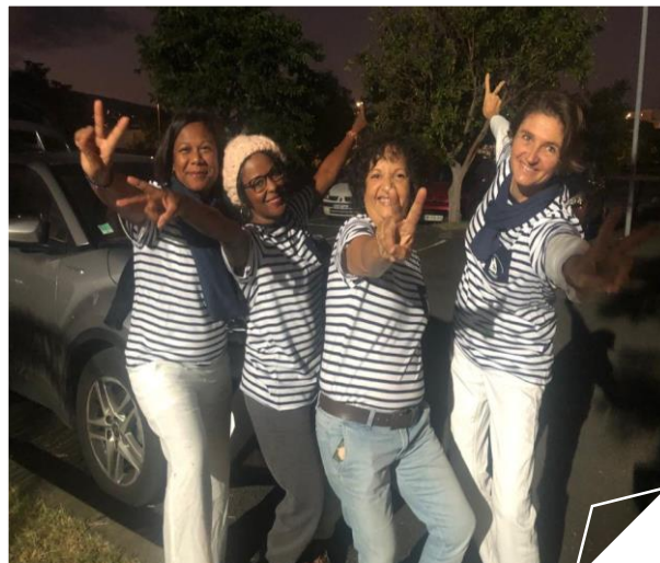
Vendredi 10 juin