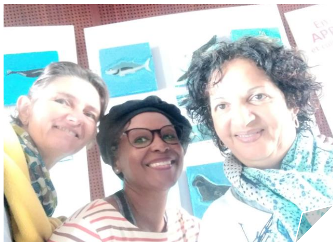
Jeudi 09 juin

Une installation sur site qui n'a pas été de tout repos : L'ensemble des réalisations a été apportée au MOCA par les agents du lycée le mercredi 08 juin. Le montage a été assuré par une équipe d'enseignantes entreprenantes.