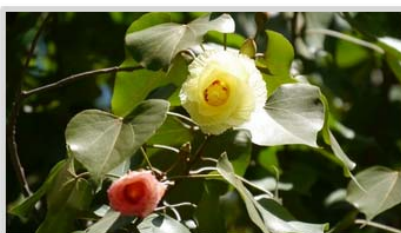
Porcher ( Thespesia populnea )