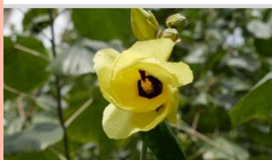
Mova ( Hibiscus tiliaceus )

Plantes endémiques : une plante est dite endémique lorsqu'elle n'existe que dans une zone à l'état spontané.