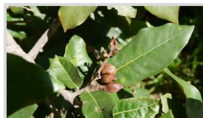
Bois de table ( Heritiera littoralis )