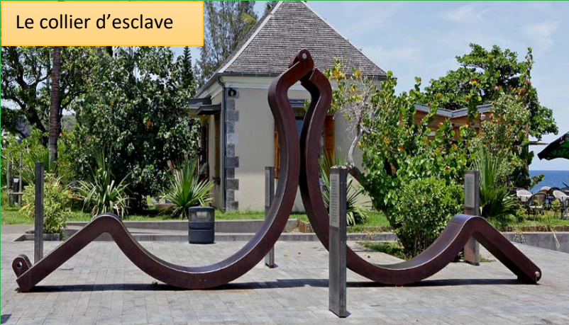
Le collier d'esclave

Le collier d'esclave est une sculpture en métal située sur la baie de Saint-Paul.