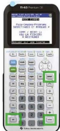
TI 83 CE