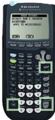
TI 82 Advanced