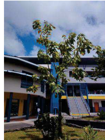
Firmiana simplex ( Parasol chinois )