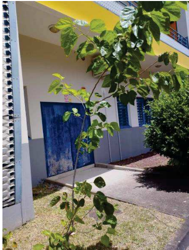
Le mûrier blanc ( Morus nigra )