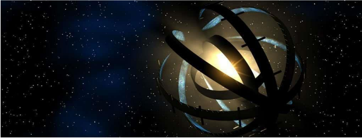
Représentation d'une sphère de Dyson

Le satellite Tess, qui recherche les exoplanètes, a-t-il découvert une sphère de Dyson en construction autour d'une étoile ? Mais qu'est-ce qu'une sphère de Dyson me direz-vous ? C'est une conjecture complètement folle émise par l'un des plus grands esprits du siècle dernier : Freeman Dyson.