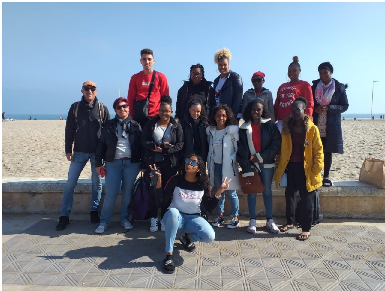
Les élèves de la SEP et leurs professeurs à la plage Malvarossa de Valencia

Les élèves de SEP sont partis en Espagne pour effectuer un stage professionnel dans des entreprises.