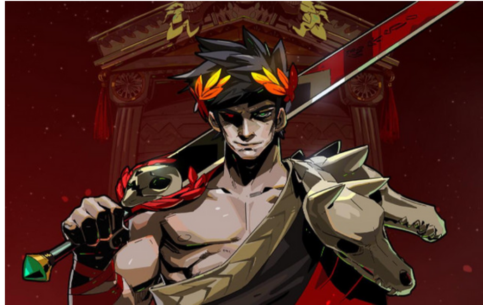
Illustration de jeu Hades SuperGiant Games