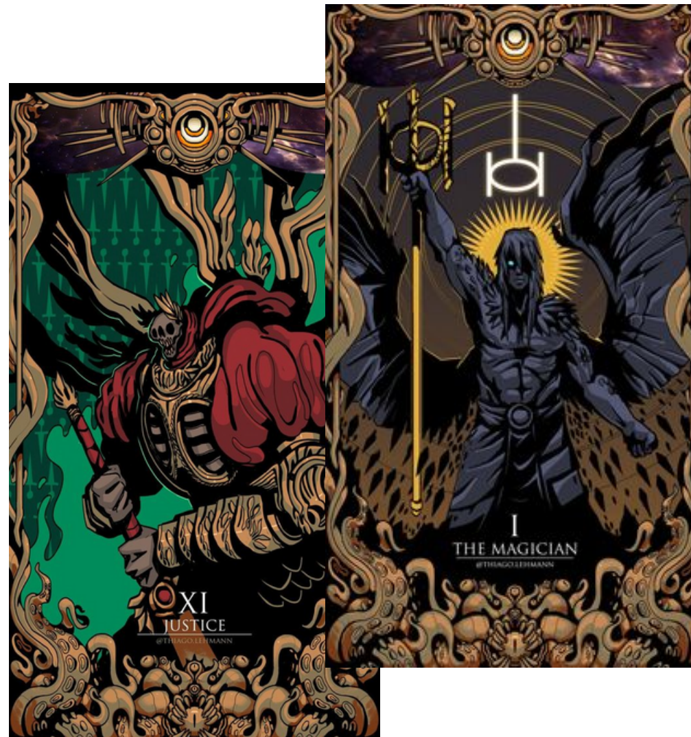
Illustration par Thiago Lehmann