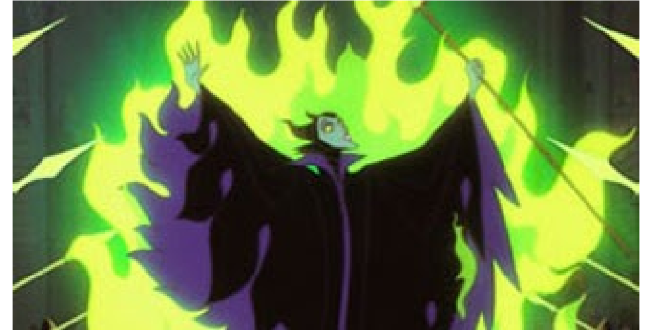
Illustration de Maléfique de "La Belle au Bois Dormant", Disney