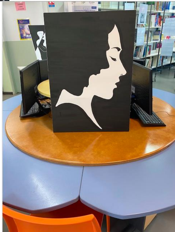
Œuvres réalisées par les élèves de la première année CAP Agent de Sécurité (1ASA).