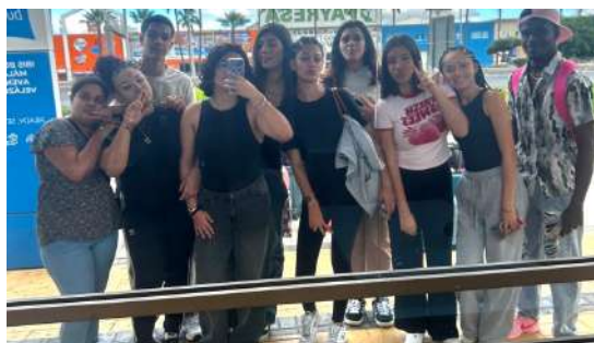
Départs des élèves, parti 1 mois en Espagne