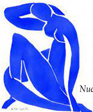
Nue Bleu II