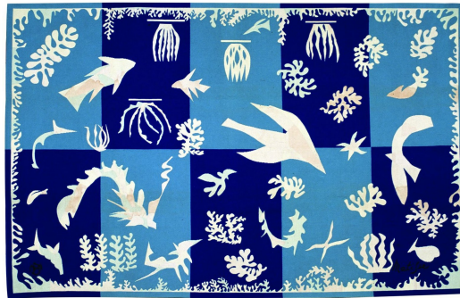
Polynésie la mer