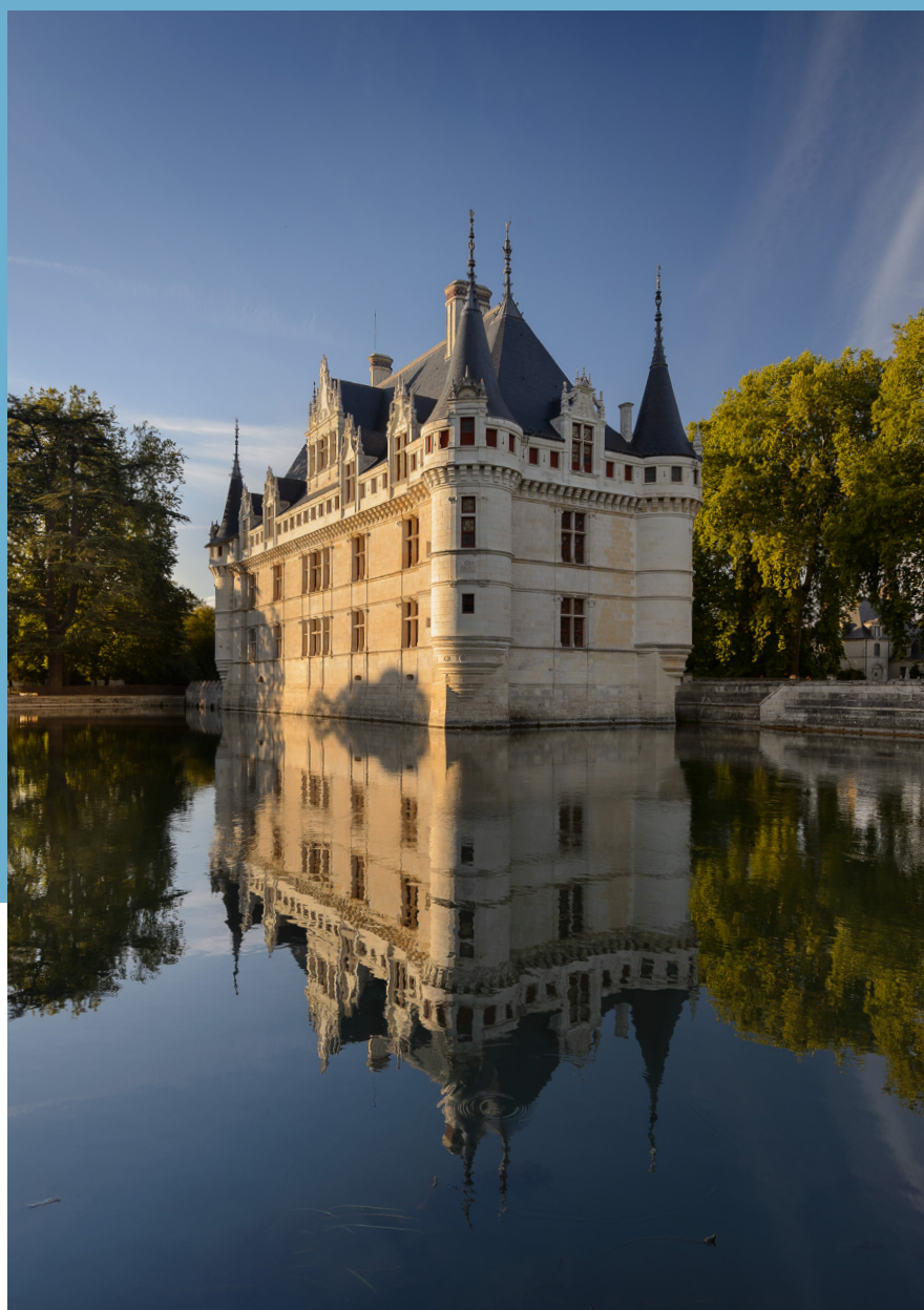
Le château d'Azay-le-Rideau

PRÉSENTATION DES VISITES GUIDÉES EN LIGNE