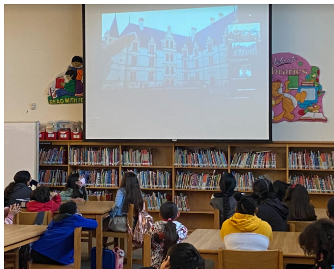
Visite guidée en ligne avec une classe de Houston, aux États-Unis

40 € pour les établissements relevant de l'éducation prioritaire (REP, REP+, CLIS, ULIS et SEGPA) et les personnes en situation de handicap