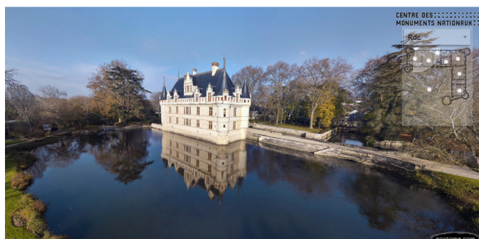
Captation utilisée pour les visites 360°

La médiatrice commente en direct une captation 360° du château.