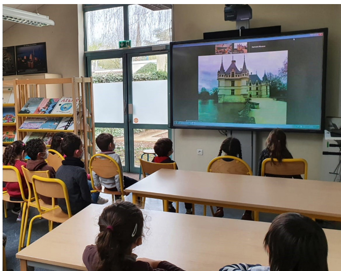
Visite guidée en ligne avec une classe de Sceaux, en France

Cette visite est entièrement conçue pour les publics apprenant le français comme langue étrangère. La médiatrice tient compte du bagage culturel francophone de chaque classe afin de proposer un contenu adapté à leurs besoins. Lors de cette visite, les élèves découvrent l'un des plus emblématiques châteaux de la Renaissance du Val de Loire.