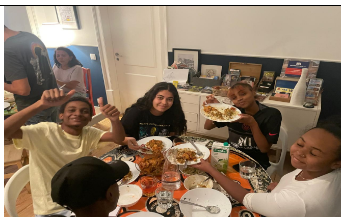
Parce que vivre en auberge de jeunesse est aussi synonyme de partages....