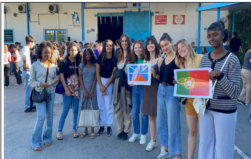
Un moment spécial pour les élèves qui accueillent une course organisée par les élèves de HEC de Bordeaux.