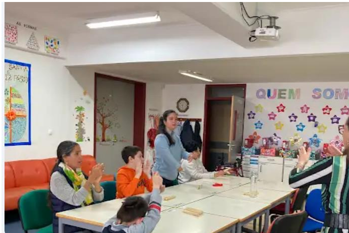
Activité de rythmes corporels menés par la professeur de musique/Théâtre