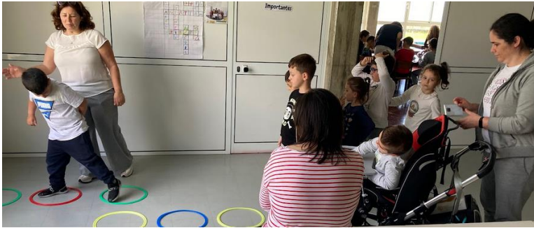
La maîtresse de l'EBI

Classe des 6/8 ans: 7 élèves dont 3 avec TSA, 1 avec maladie dégénérative invalidante, 2 avec des troubles de l'attention et 1 avec déficience intellectuelle.