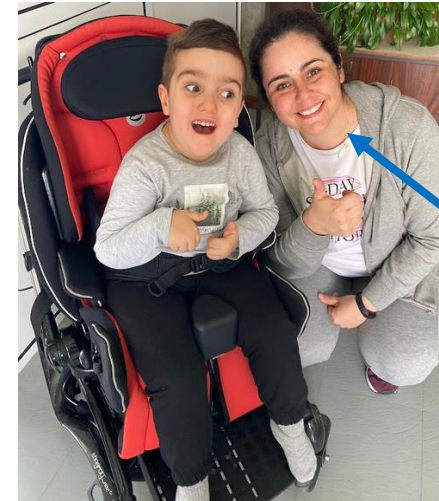
La maman tient le rôle d'AESH