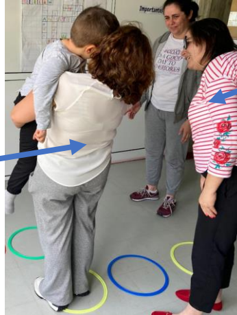
La maîtresse de la classe, enseignante spécialisée