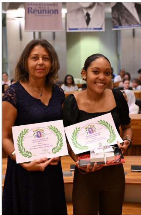
1 er Prix ELCAMAN Djamelia SP 352 Lyc. Paul Vergès