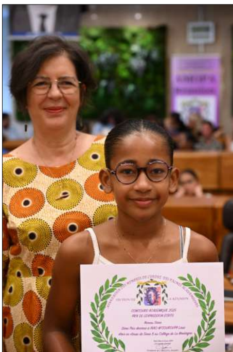
2ème Prix IBAO M'COUROUPA Lasa 5ème Clg de La Montagne