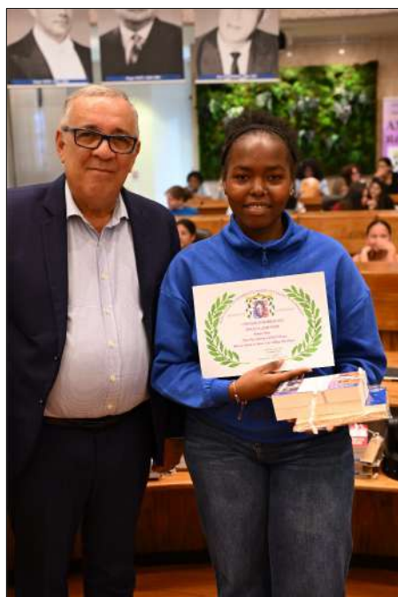
2 ème Prix SOILHI Raïssa 3 ème Clg. Elie Wiesel