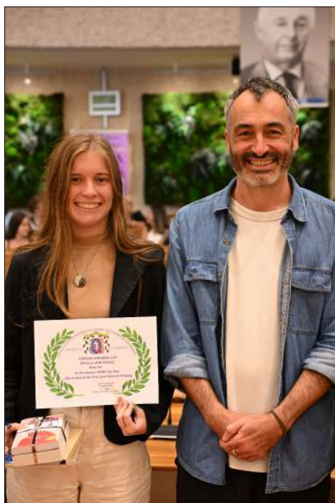
1er Prix AUDINO Lily-fleur 1ère Lyc. Antoine de St Exupéry