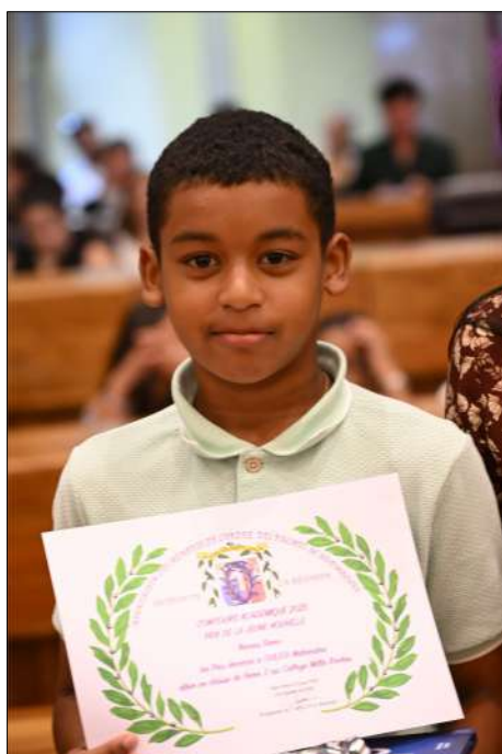
1 er Prix OULEDI Mahendra 6ème Clg Mille Roches