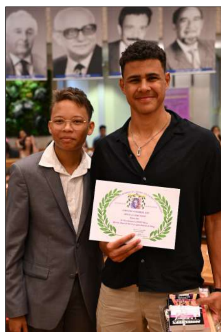
1 er Prix LUNTADI Keona 1 ère Lyc. Evariste de Parry