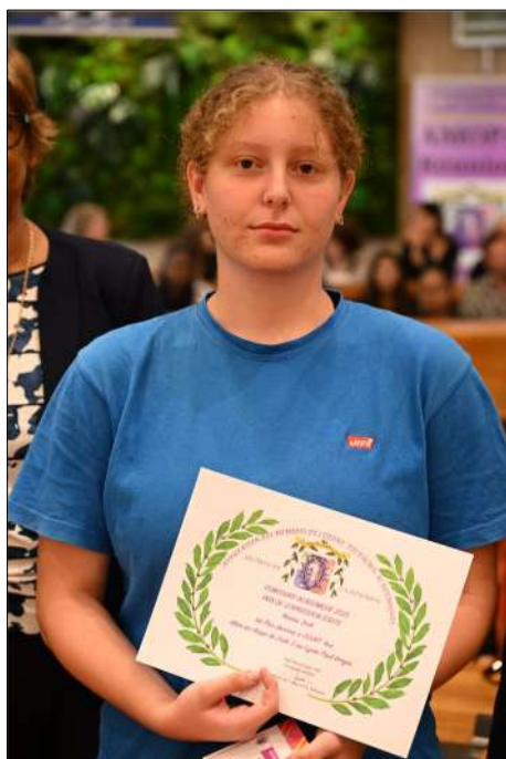
1 er Prix COURT Ava Seconde Lyc. Paul Vergès