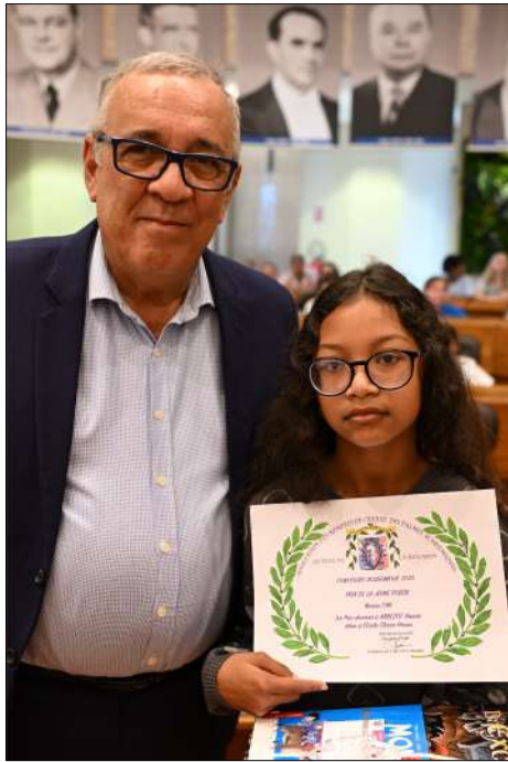
1 er Prix ABBEZOT Hanaé CM1 École Claire Hénou