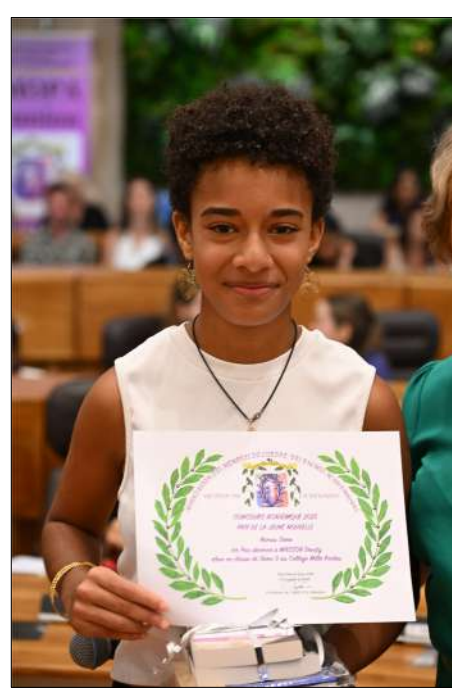
1 er Prix MASSON Devaty 5ème Clg Mille Roches