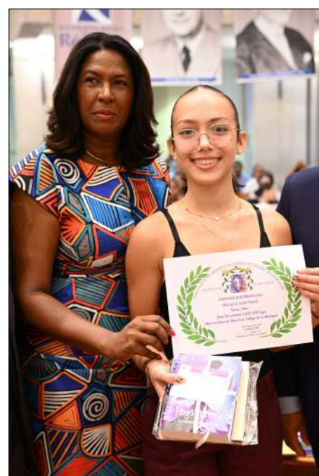
3 ème Prix DEELJORE Leya 3 ème Clg. De La Montagne