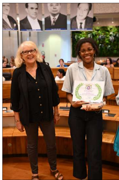
3ème Prix YEHOHENOU Ariel Sec Lyc. Antoine de St Exupéry