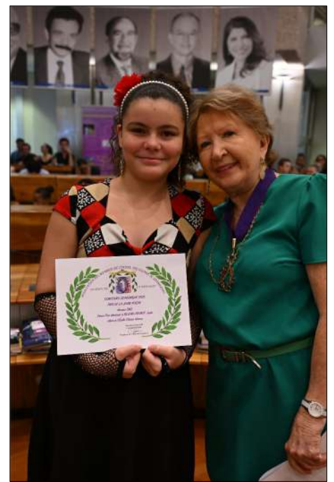
3 ème Prix DEJEAN-PROBST Jade CM2 École Claire Hénou