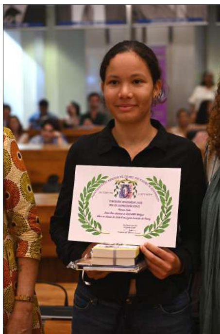
2 ème Prix GUEDAMA Malyse Sec Lyc. Evariste de Parry